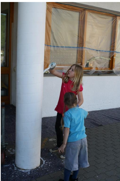
Die Fassade der Schule bekam einen Graffitischutzanstrich.