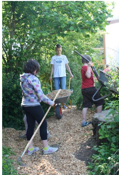
Im Bereich der Strucher wurde neuer Holzhacksel verteilt