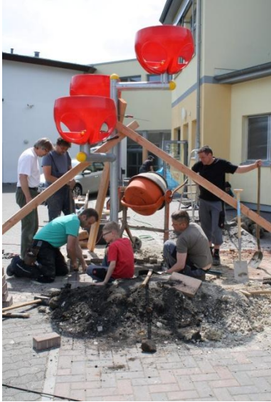
Ein Surprisekorb wurde auf dem Schulhof errichtet.