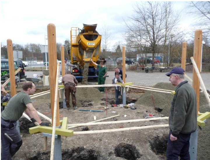
Die Fundamente des neuen Spielgerätes werden betoniert.